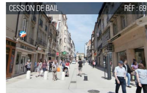
CESSION DE BAIL RÉF : 691

Le + : Grande façade pour signalétique et arrêt tramway.