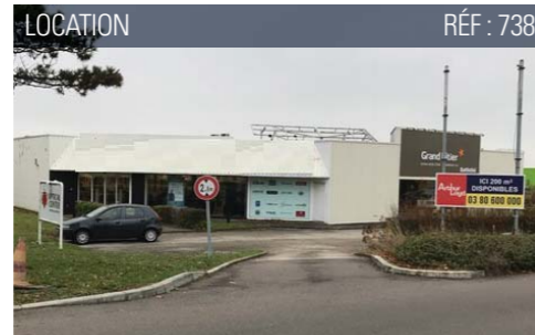
LOCATION RÉF : 738