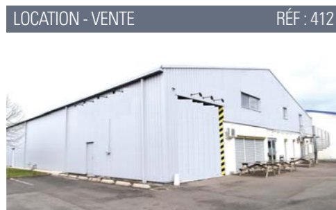
LOCATION - VENTE RÉF : 412