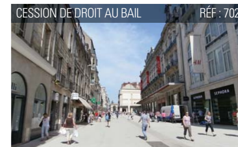
CESSION DE DROIT AU BAIL RÉF : 702

Le + : Places parking sur le devant du local.