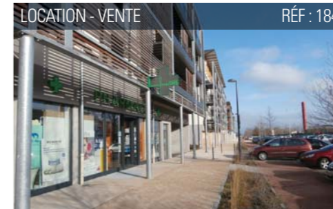
LOCATION - VENTE RÉF : 184

145 m 2 DIJON EST PROCHE HOPITAL DU BOCAGE