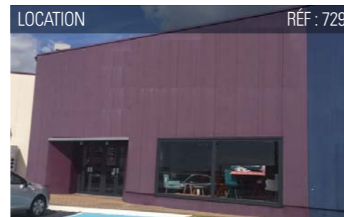
LOCATION RÉF : 729