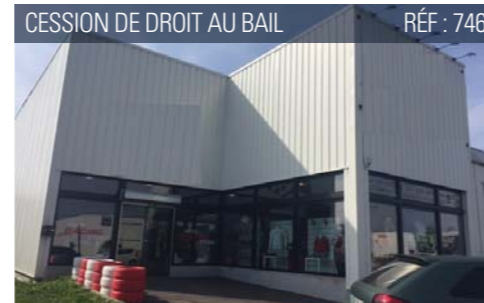
CESSION DE DROIT AU BAIL RÉF : 746