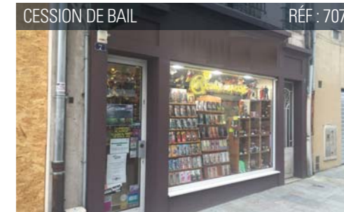
CESSION DE BAIL RÉF : 707