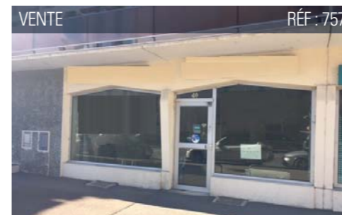
VENTE RÉF : 757

Le + : Grand parking public de plus de 300 places.