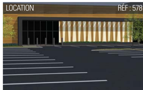
LOCATION RÉF : 578

Le + : loyer et prix de cession attractifs.