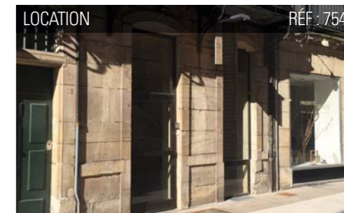
LOCATION RÉF : 754