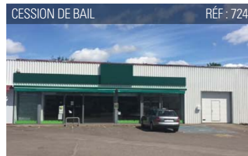
CESSION DE BAIL RÉF : 724