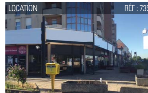
LOCATION RÉF : 735