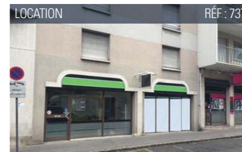
LOCATION RÉF : 737